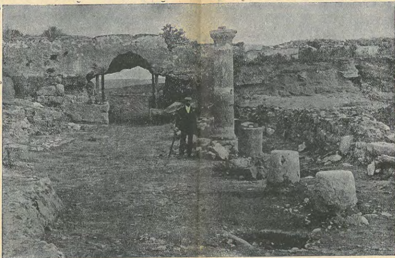
EXCAVACIONS D'EMPORIÈS.—Porta d'entrada S. de la ciutat ibero-romana i carrer principal de la mateixa.

Els ous dels insectes poden ésser postos ja aïlladament, ja en paquets, segons les especies; en el primer cas, la femella està proveïda d'una mena de taladre o sabre nomenat ariscapte , amb el qual fa forats a terra o en les soques dels arbres, on hi diposita després els ous. Molts mascles tenen òrguens especials per a poder retenir les femelles contra la seva voluntat.